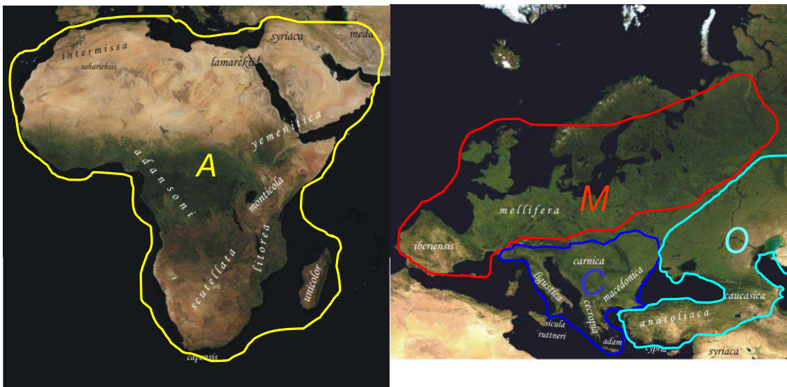
(Figure1) L'aire naturelle de répartition de l'abeille domestique recouvre l'Europe, l'Afrique et le Proche Orient. Cette espèce est subdivisée en 26 races ou sous-espèces géographiques réparties dans 4 lignées évolutives : Ouest-méditerranéenne (M), Africaine (A), nord méditerranéenne (C), et orientale (O).

La répartition géographique de la diversité observée suggère l'existence de 4 lignées évolutives (figure1) chez l'abeille, chacune regroupant chacune plusieurs races géographiques: la lignée M (races ouest-méditerranéennes), la lignée A (races africaines), la lignée C (races nord-méditerranéennes), et la lignée O (races de Turquie et du Caucase).